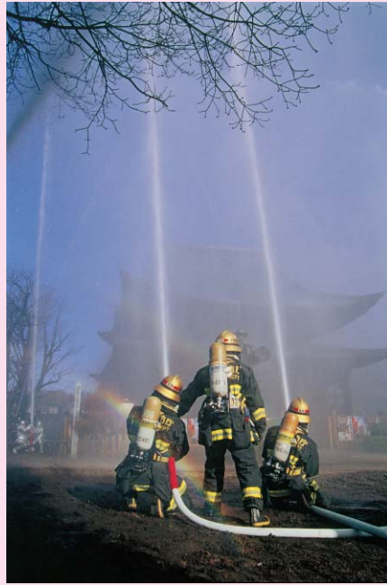
「守るこ国玉」(正福寺)