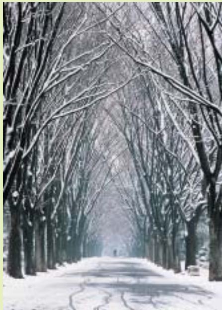
「雪のけやき通り」(小平霊園)