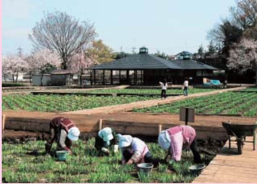
「菖蒲苑の手入れ」(北山公園)