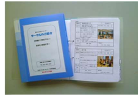
「サークルのご紹介」冊子

あなたも趣味の世界を広げ、一緒に楽しんでみませんか！ 登録団体を紹介した「サークルのご紹介」冊子は、窓口 常備してあります。興味のある方はご参照ください。