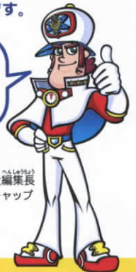
時空通信社編集長 トキオ☆キャップ