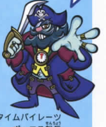
タイムパイレーツ ポックス船長

時空手帳に書かれた謎を解読し、実際にその場所に行ってみよう。答えが合っていればタイムパイレーツが仕掛けた「秘密の暗号」を解くキーワードがゲットできるよ。