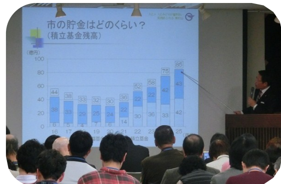
(昨年度開催時の様子)

市民の皆さんが「東村山市のオーナーである」という意識を、更に高めていただくお手伝いできればと考えています。