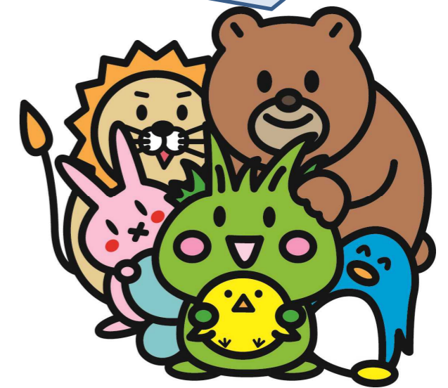
東村山市公式キャラクター ひがっしー

このパンフレットはそれぞれの計画の関連性を分かりやすくまとめたものです。 この地域が、どのような計画によってかたち作られているのか、ぜひご覧ください。